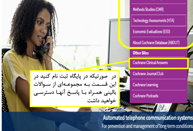
Automated telephone communication systems For prevention and management of long-term conditions

در صورتیکه در پایگاه ثبت نام کنید در این قسمت به مجموعه‌ای از سوالات بالینی همراه با پاسخ آنها دسترسی خواهید داشت