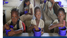
Nutrition: call to action